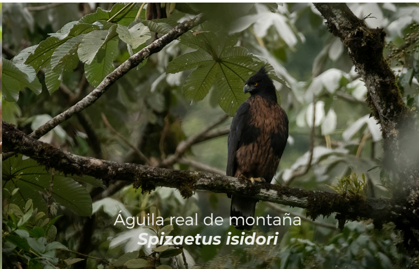
Águila real de montaña Spizaetus isidori