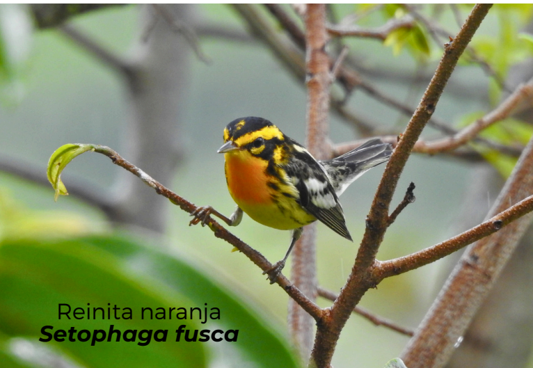
Reinita naranja Setophaga fusca